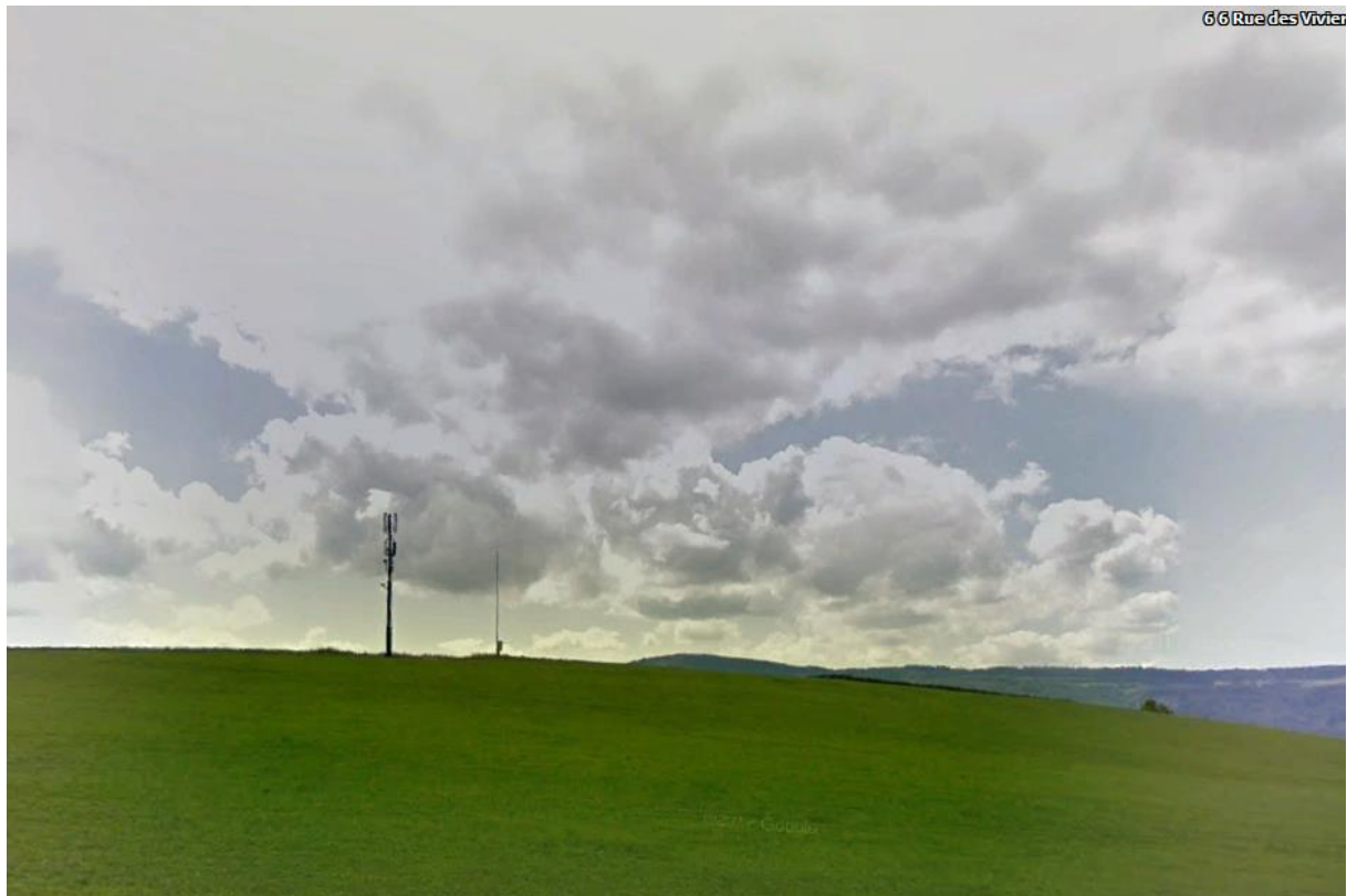
Von der Quartierstrasse im Norden des Senders aus gesehen.