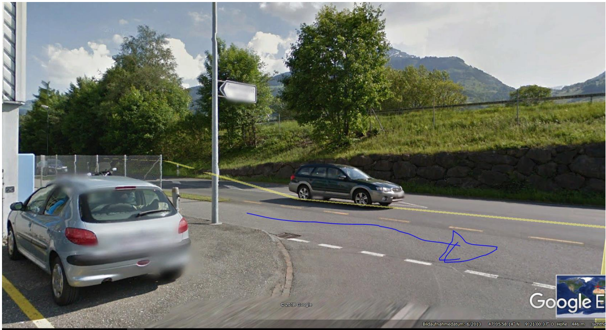
Sicht nicht sehr weit, Gegenlicht für Automobilistin, FR rechts unerwartet für Einbiegerin