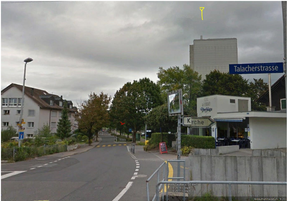
Sender von rechts, hoch