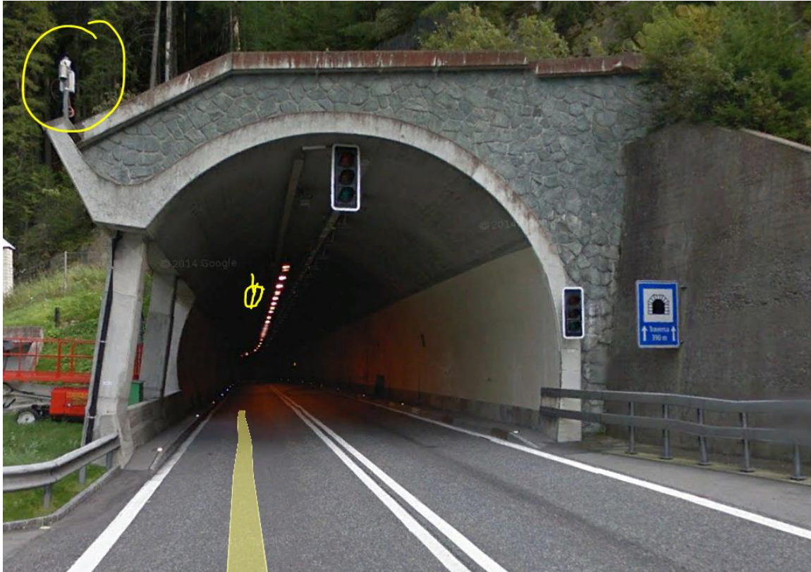
Einfahrtseite, Sender oben links, 2016 „mittel“, unten Senderposition innerhalb Tunnel, nach 20m