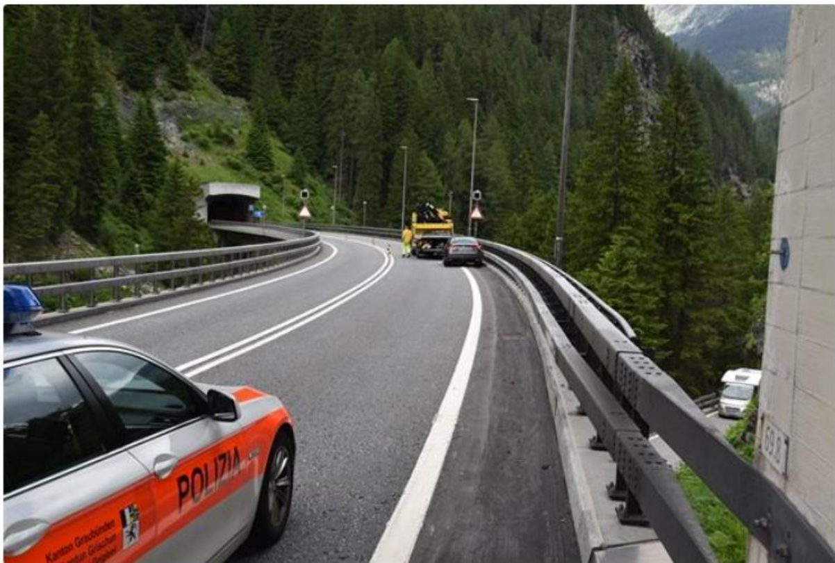
Sufers GR - Wegen medizinischem Problem mit Leitplanke kollidiert