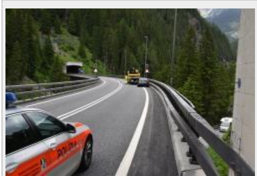
Sufers GR - Wegen medizinischem Problem mit Leitplanke kollidiert

Seine 84-jährige Ehefrau wurde leicht verletzt und mit der Ambulanz ins Spital nach Thusis gebracht. Während der Rettungs- und Bergungsarbeiten war die A13 in beide Richtungen gesperrt. Die Kantonspolizei Graubünden leitete den Verkehr über die Kantonsstrasse um.