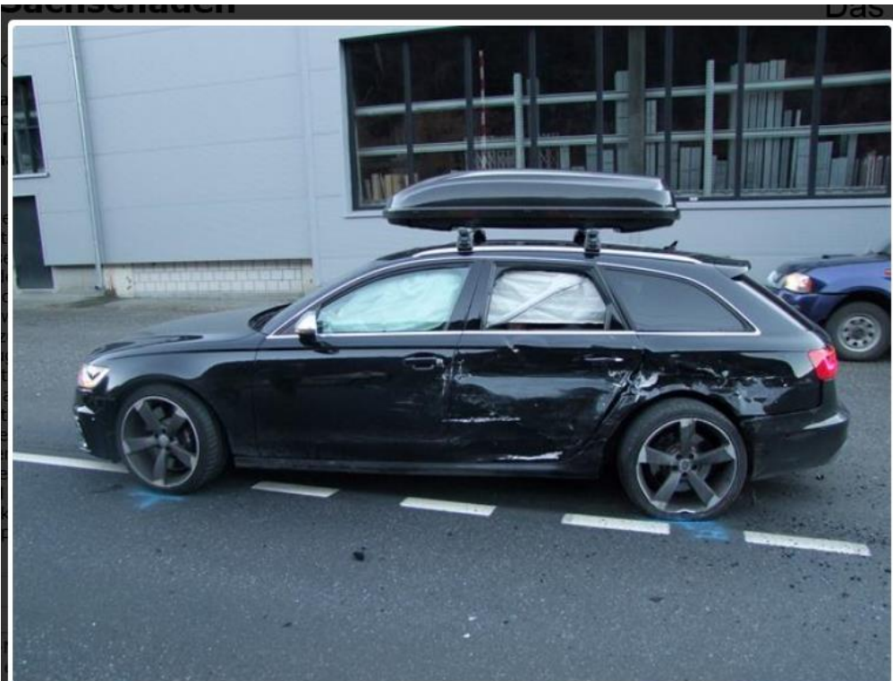
Fideris Station GR - Mehrfachkollision mit hohem Sachschaden

Das am stärksten beschädigte Fahrzeug, weit weg, vermutlich Verursacher. Steilheck (Betriebsfunk Rhb von hinten)