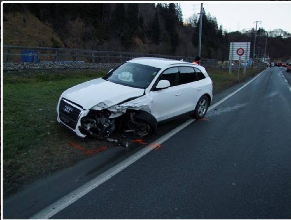
Fideris Station GR - Mehrfachkollision mit hohem Sachschaden