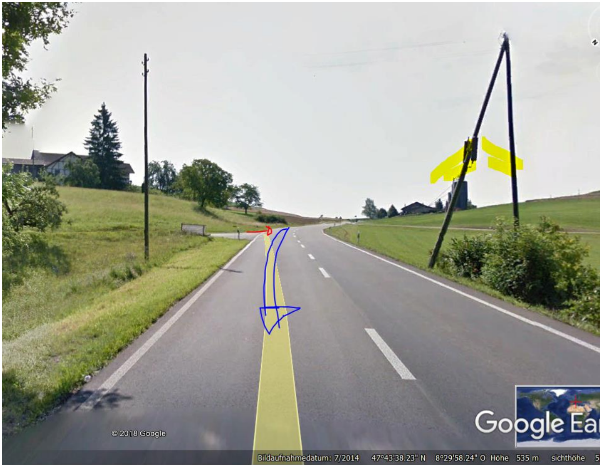
Herfahrt m vor dieser sehr tief montierten Antenne gsm mittel.