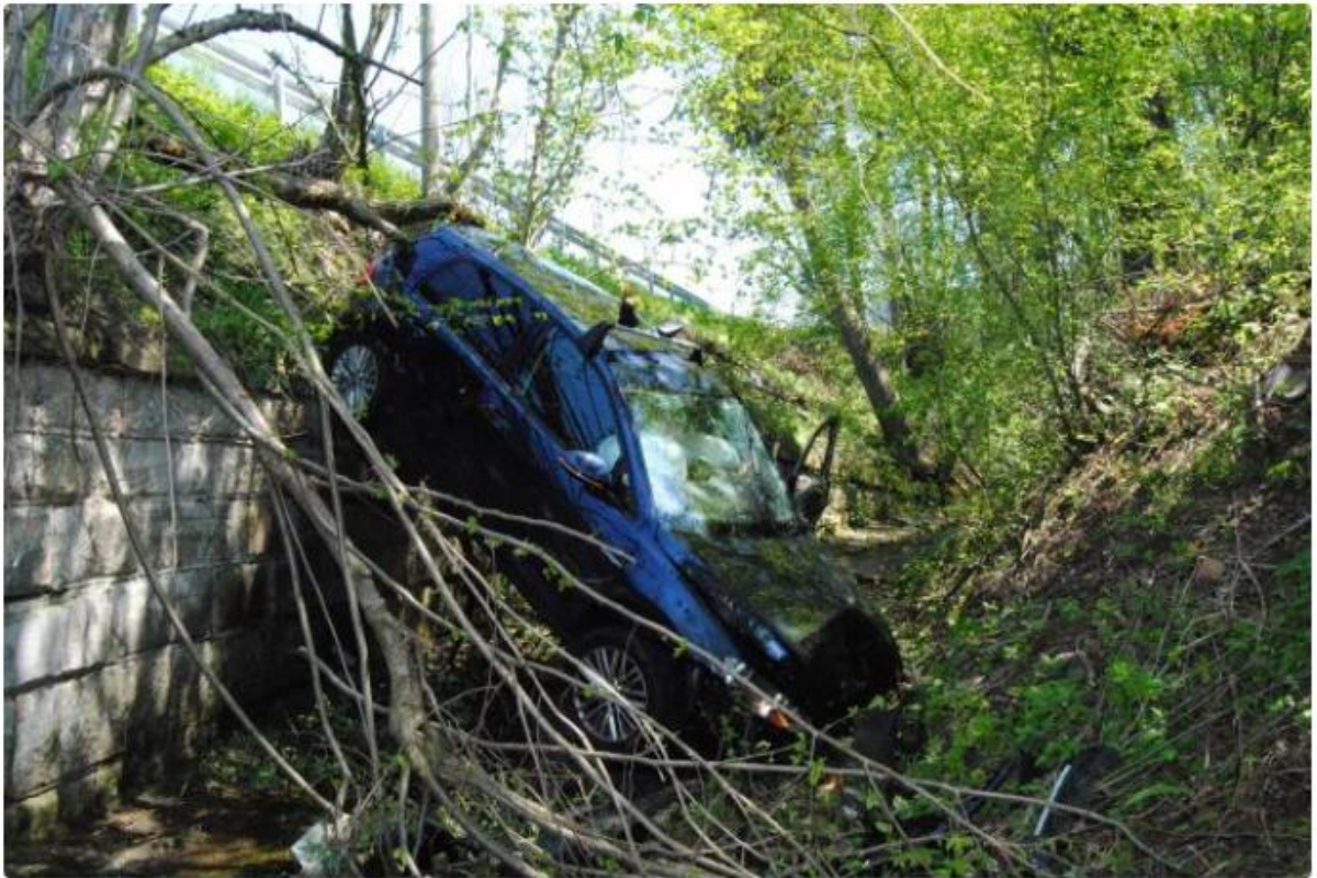
Schleitheim SH - Alleinunfall endet in Bachbett

Am Samstagvormittag (07.05.2016) um zirka 11:45 Uhr lenkte eine 40-jährige Schweizerin ihr Fahrzeug auf der Schaffhauserstrasse (H14) von Siblingen her in Richtung Schleitheim. Kurz vor der „Hohbrugg“ überquerte die Lenkerin aufgrund eines Sekundenschlafes die Gegenfahrbahn, fuhr einen Leitpfosten um und stürzte nach gut 40 Metern Fahrt am Böschungsrand ins Bachbett des Zwärenbachs. Das Unfallauto kam dort mit der Fahrzeugfront im Bach steckend zum Stillstand. Die Lenkerin wurden bei diesem Verkehrsunfall leicht verletzt, konnte sich aber selbstständig aus dem Fahrzeug befreien. Das Unfallauto musste von einer privaten Bergungsfirma abtransportiert werden.