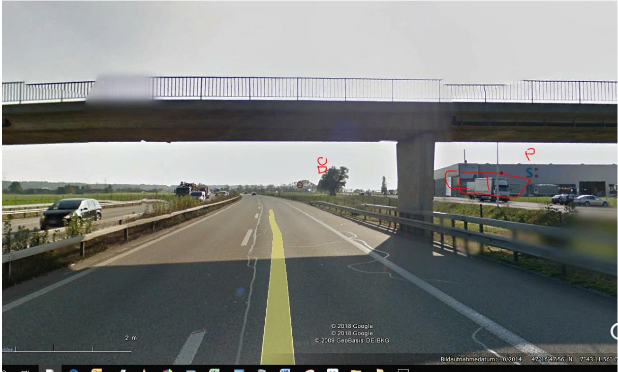
Diese Passage hat noch Leitplanken bis 50-60m nach der Brücke