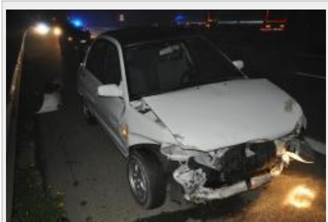
Oensingen SO - Selbstunfall auf der Autobahn A1 - Zeugenaufruf

Rechts parkierter LKW-Anhängerzug auf Parallelstrasse neben Autobahn