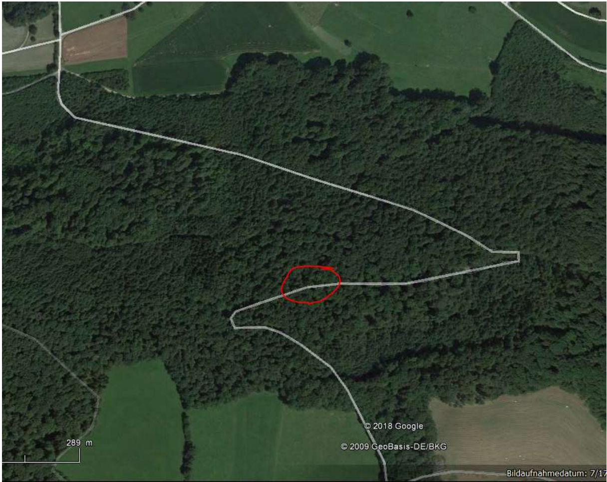
Der vermutliche Unfallstandort. Kt.Solothurn macht leider keine Angaben mehr.