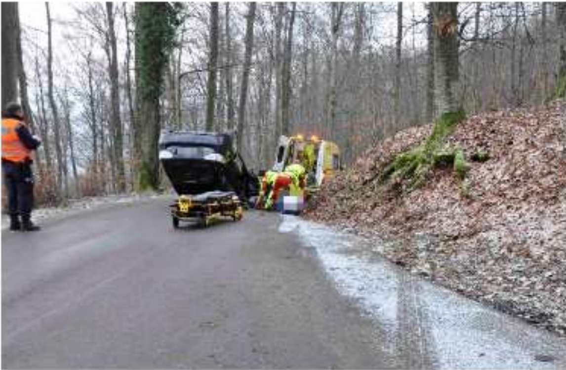
Fahrzeug hatte Schrägheck, was nicht für einen Einfluss von hinten spricht.