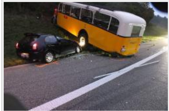
Gossau SG - Oldtimerpostauto bei Unfall stark beschädigt

Durch den Anprall stellte es das Postauto wieder auf die Räder. Sowohl der Autofahrer, wie auch der alleine im Postauto fahrende 57-jährige Chauffeur blieben glücklicherweise unverletzt. Für die Bergungsarbeiten musste die Autobahn kurzzeitig gesperrt werden.