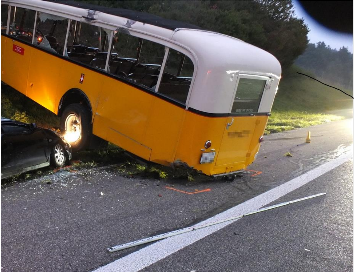
Zaun an Böschung, oben Bewaldung