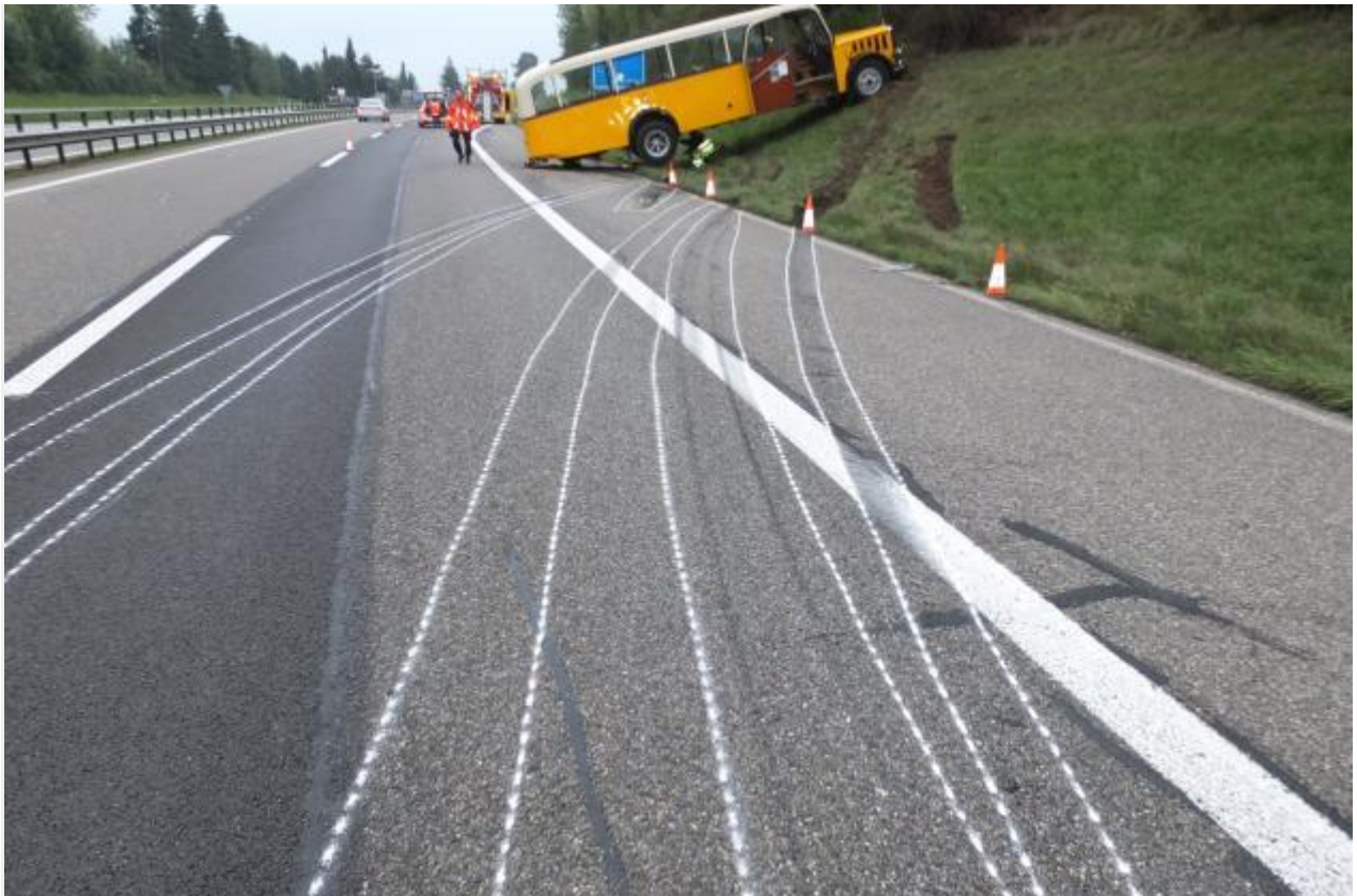
Gossau SG - Oldtimerpostauto bei Unfall stark beschädigt