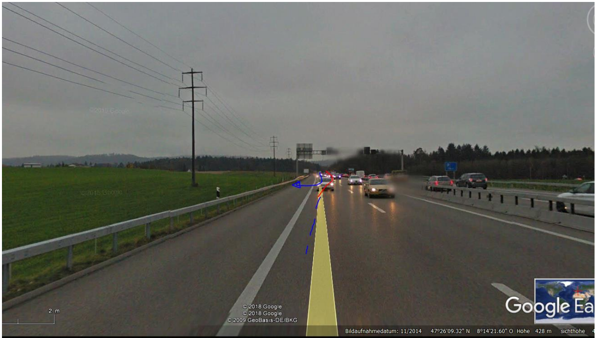
Herfahrt, von hinten beim Wald Sender, in Passage Wald (2/3, links) vermutlich PC-Mast,