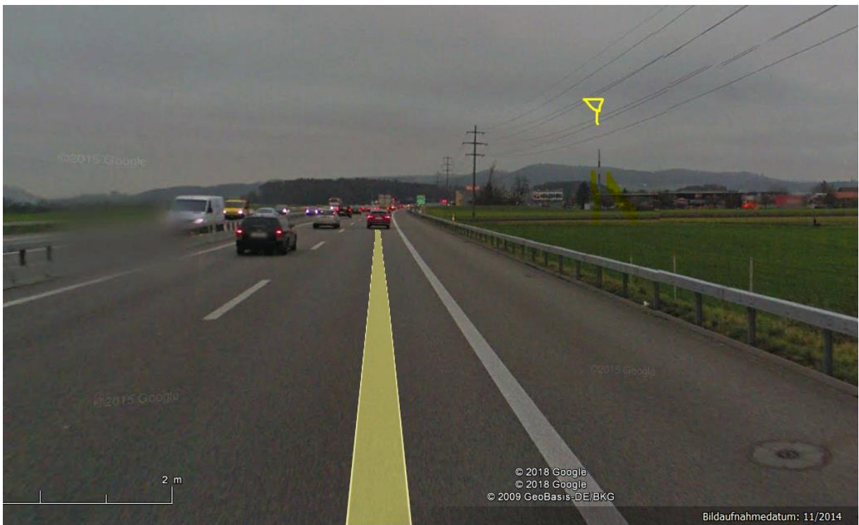
Von vorne Sender am Kamin, freie Einstrahlung