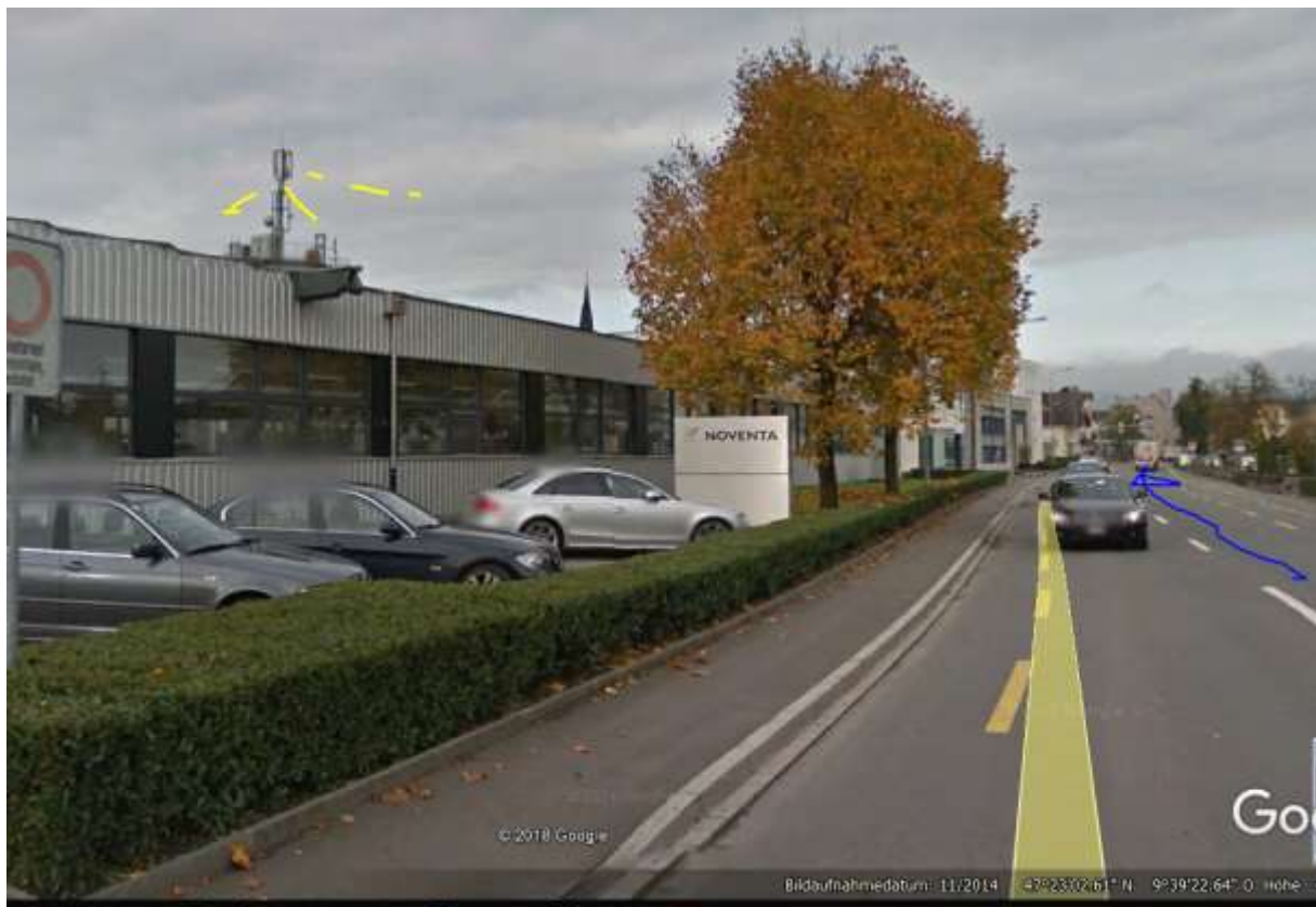
SE 3 durch Gebäudelücke wieder wirksam: