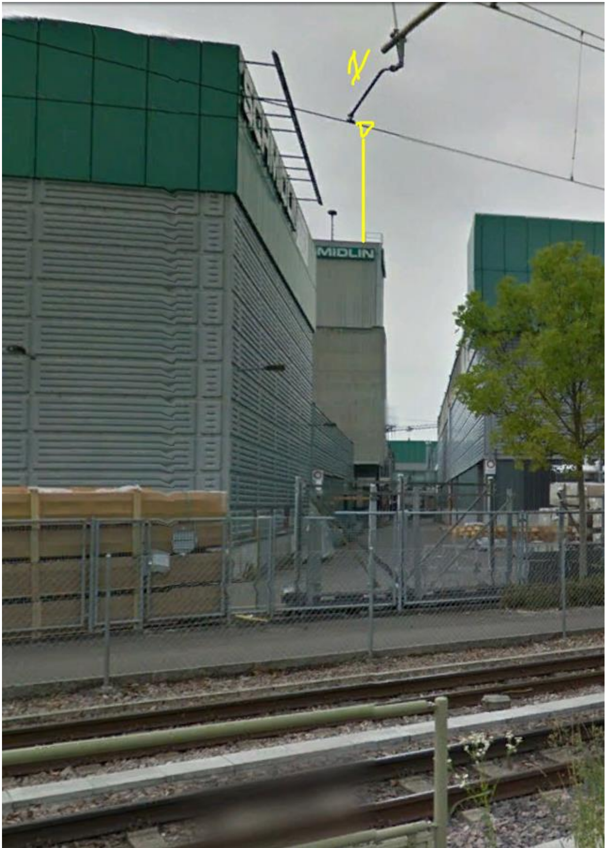
Neu errichtet seit google-Street-view 2013/2014