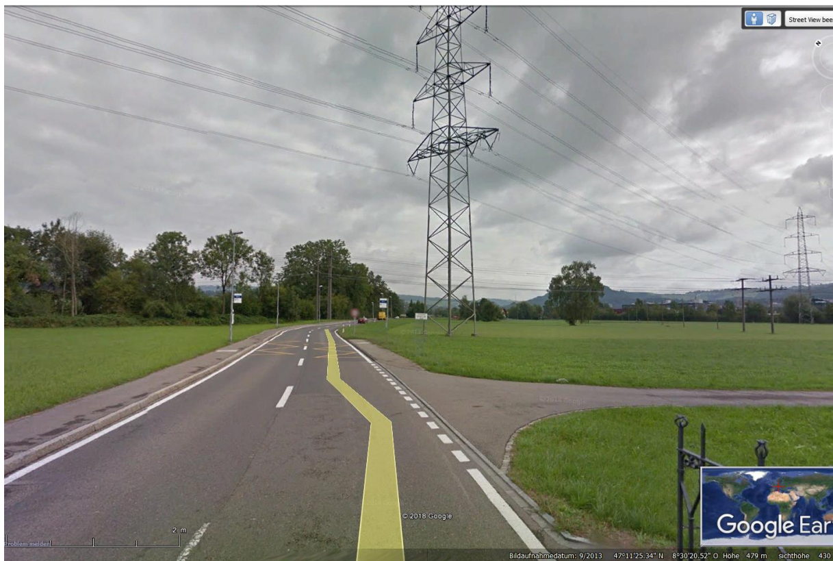
es ist nicht nur eine Hochspannungs-Ebene 1 querend, sondern noch 2 x Ebene 5