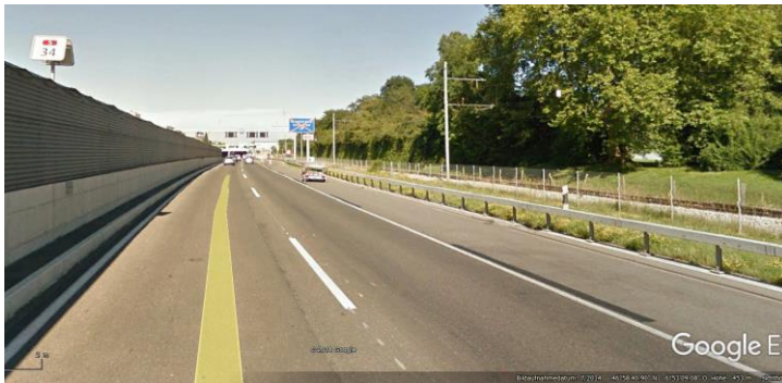
km 34.0 beim Beginn der Schallschutzwand

https://www.ne.ch/autorites/DJSC/PONE/medias/Pages/20180813-A5-Auvernier-acc-avec-blesse.aspx