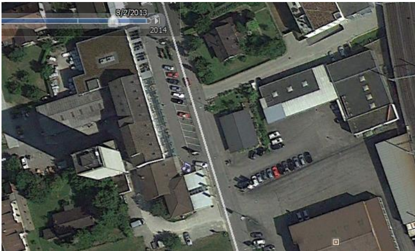
2013 bestand der Silo- Standort Landi noch, hingegen war er bis zum Sommer 2014 bereits rückgebaut....