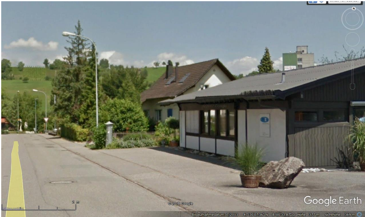
Der zweite Senderstandort ist rechts über dem Eternitdach, 2014 noch nicht erstellt