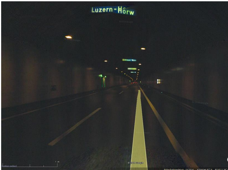
Spiertunnel (LU) - Kriens, Hörw