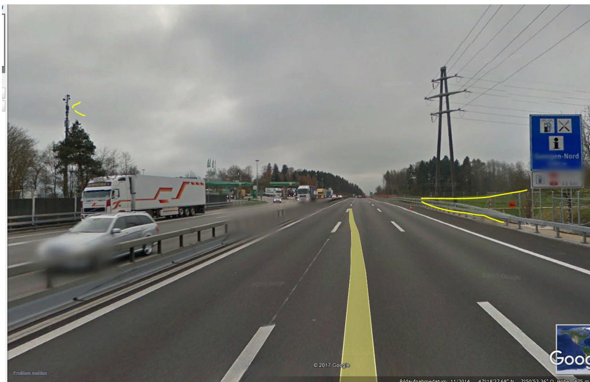
Magnetfeld fällt spontan ab auf Höhe RP Gunzgen süd, gleichauf mit Senderposition.