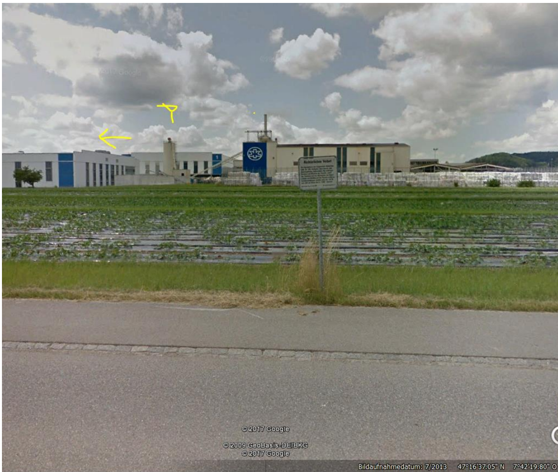
Sender neben ARA-Areal, deckt Autobahn ab.