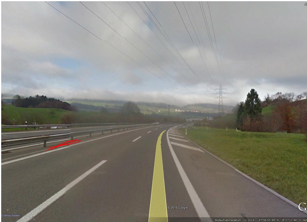
Alter Leitplankendefekt hier sehr deutlich