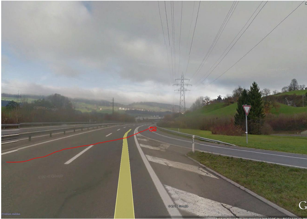
Stelle mit letzter Rutschbewegung