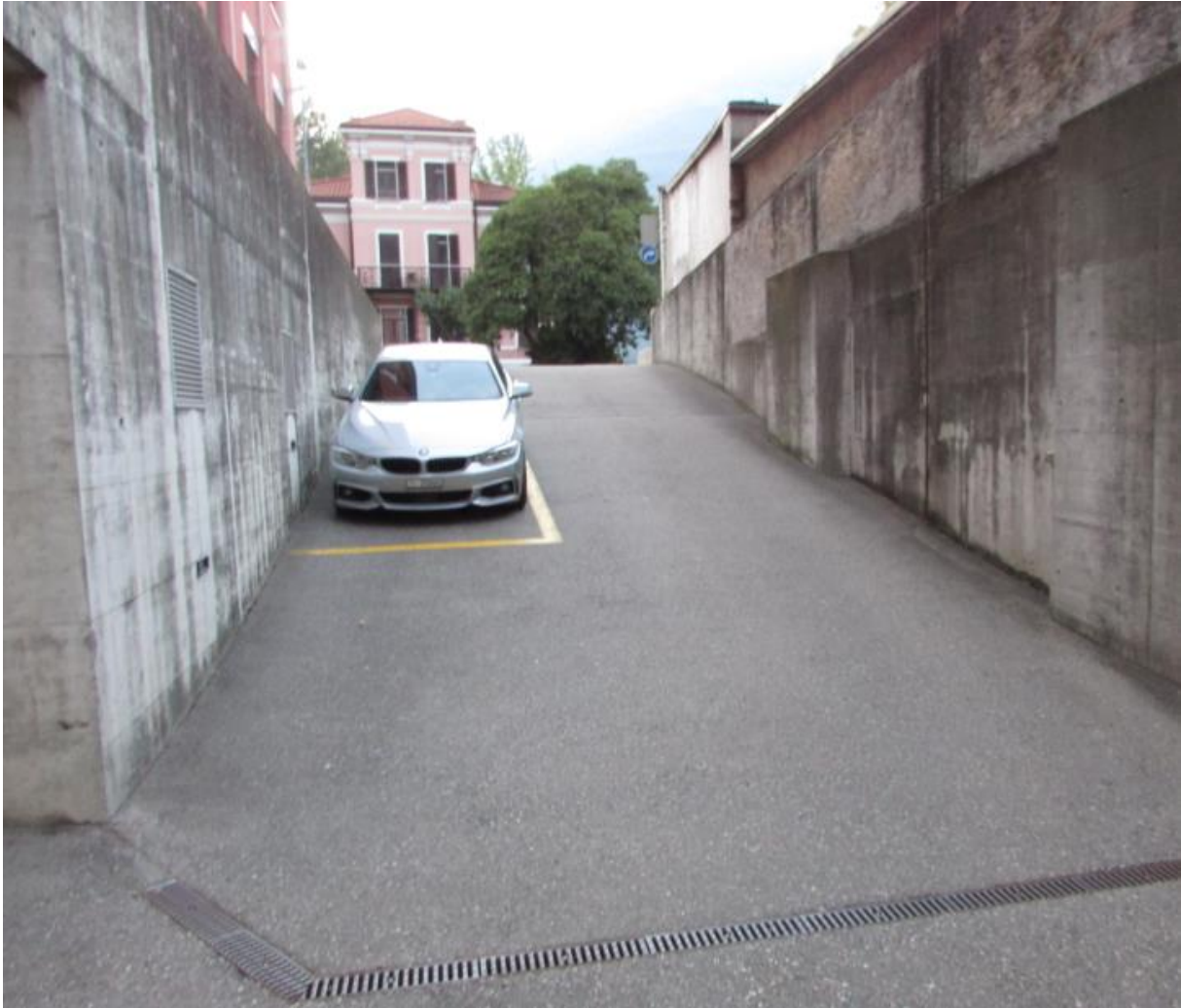
Der BMW hier auf dem ersten P hat einen Streifschaden am linken vorderen Kotflügel