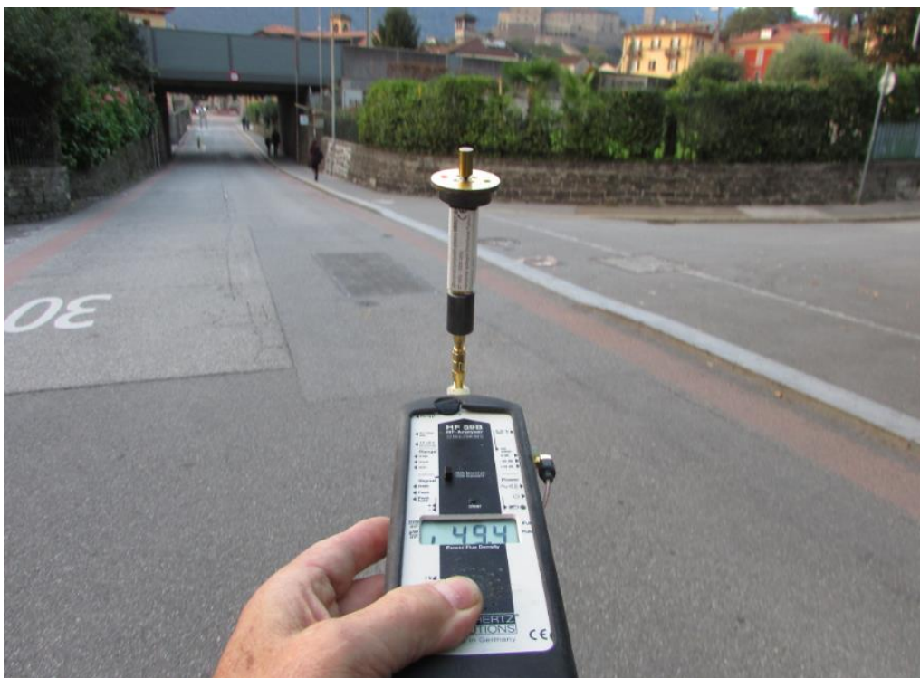
Beim eigentlichen Abbiegeort mit knapp 50 mW/m 2 wenig Belastung, das Problem für den zu knappen Entscheid entstand allerdings weiter oben, beim Ort mit wlan links