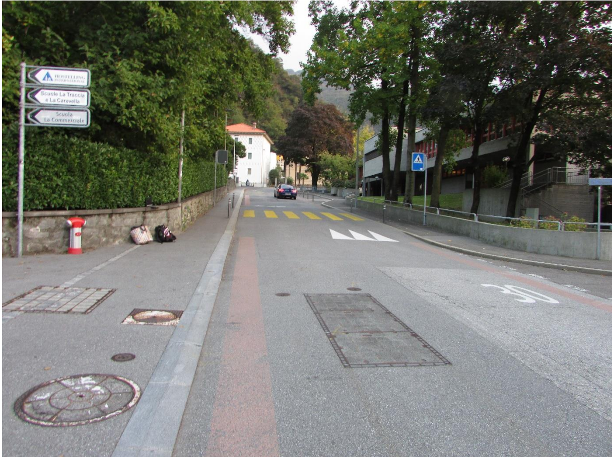
Strecke mit Gefälle, unterschätzt Geschwindigkeit des Radfahrers. Sender sind kaum erkennbar: