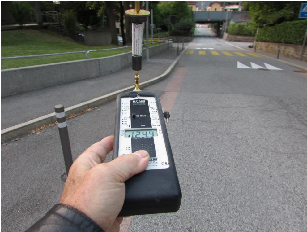
Beim Schulgebäude 50m oberhalb wlan von links, max125uWm/2