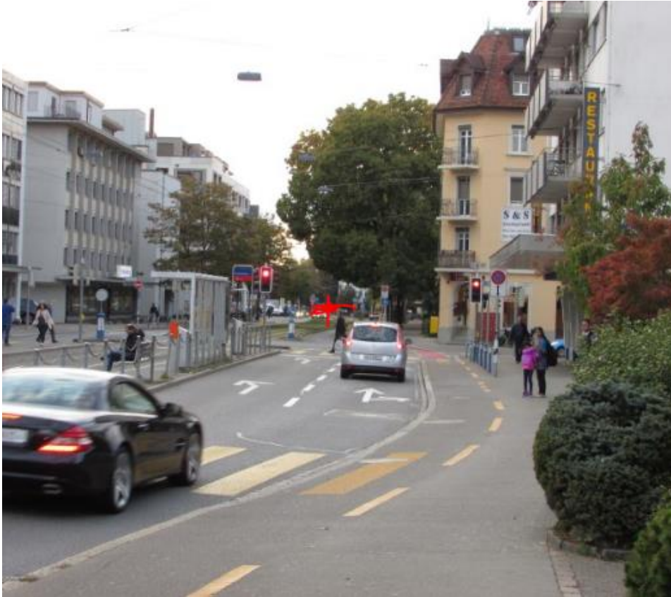
Sender von Restaurant Freihof her