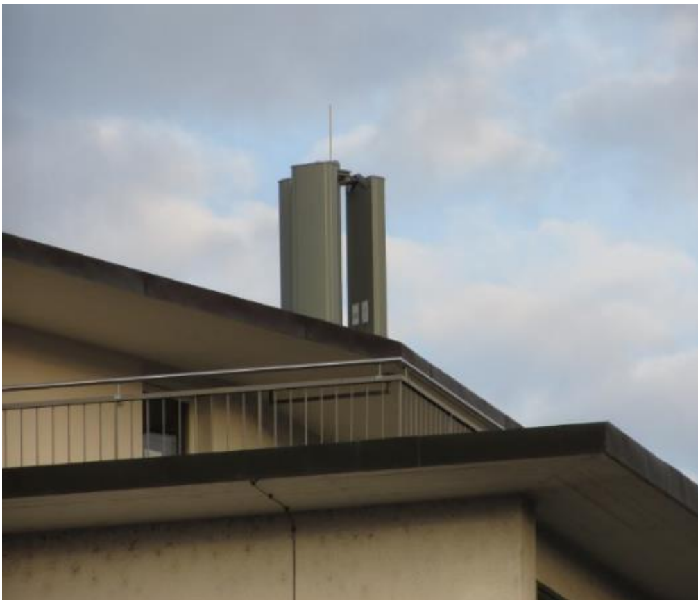
Kürzlich erneuert (Bild: vom September 2017)