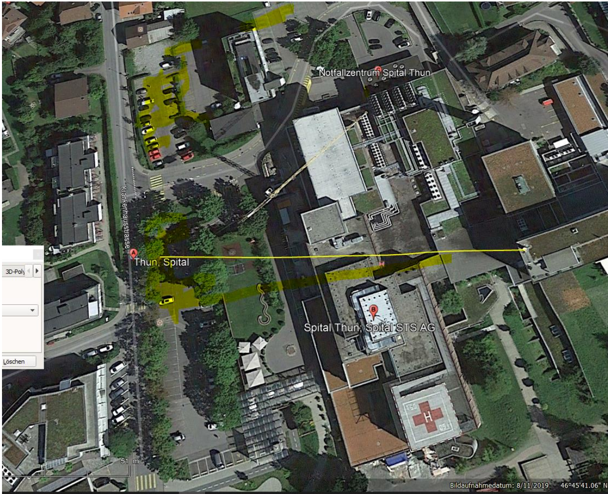
Gelb: Areale mit hoher Belastung durch spitaleigene Funkstrahlung