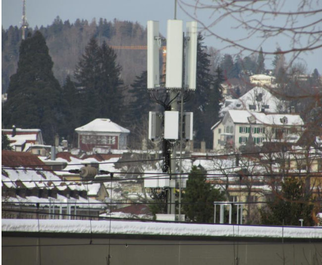
Sender Elektrofachschule Fürstenlandstrasse