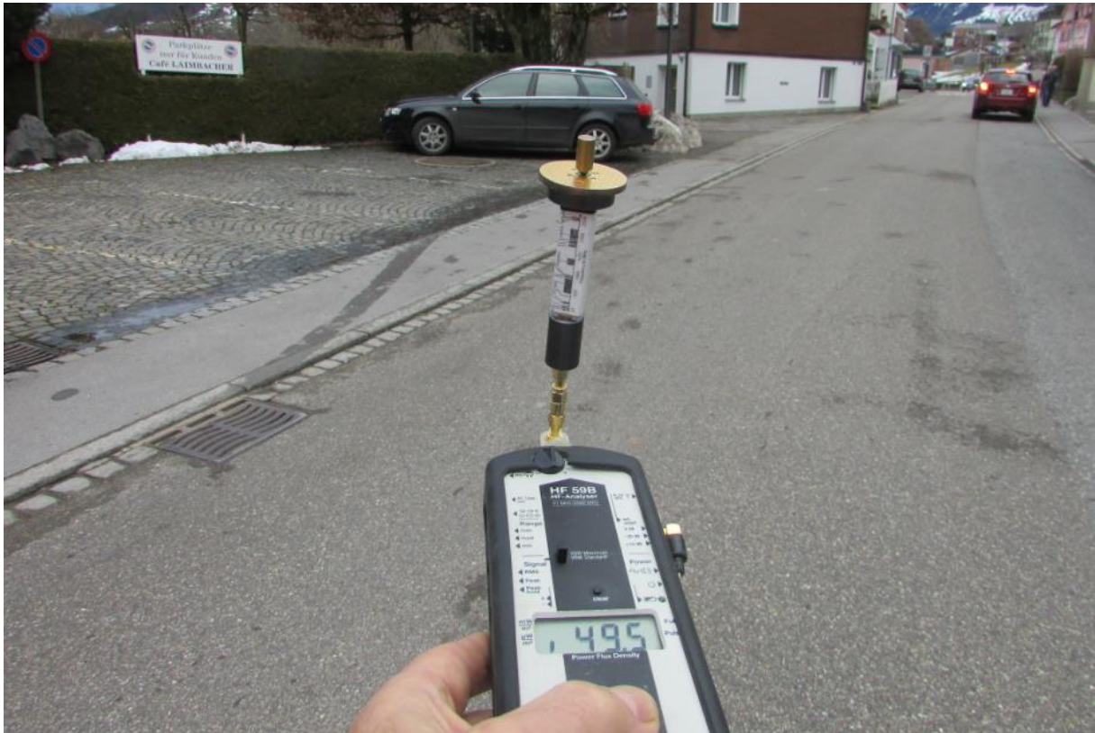
Messung am 22.12.20, 15:00 49.5 \mu\text{W}/\text{m}^2 peak, vorher Höhe Cafe 118