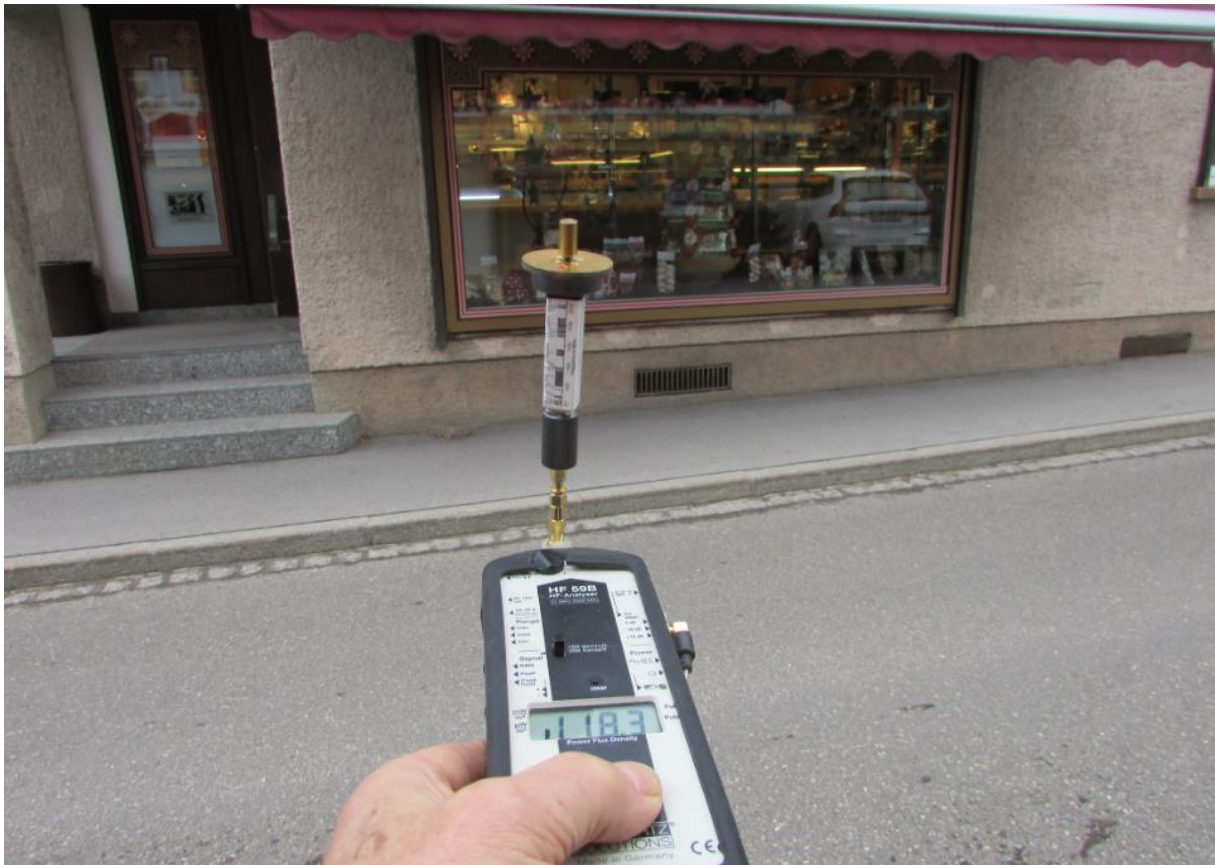
Keine herausstechende Funkbelastung in diesem Abschnitt.