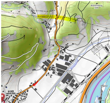
HS-1-Querung vor 1700 m und HS 3 vor 500m