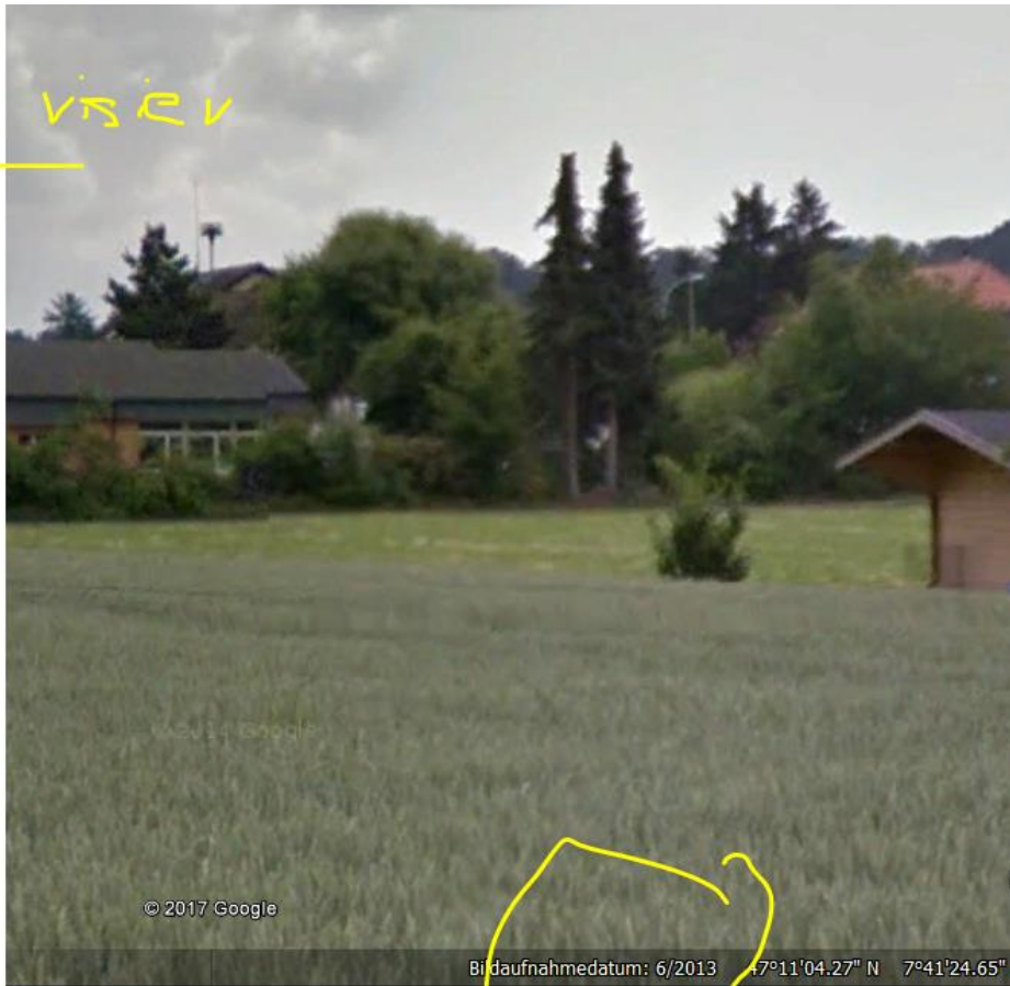
Vermutlich neues Gemeindehaus, Street-view unterdrückt.