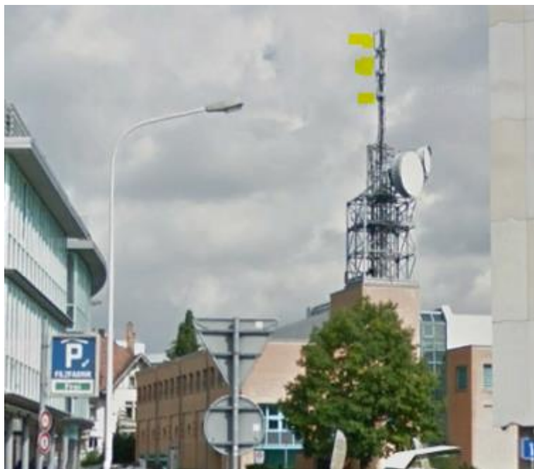
Sender von Süden