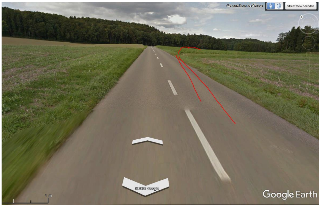
Der Sender Waarthau dürfte die Strecke nicht erreichen