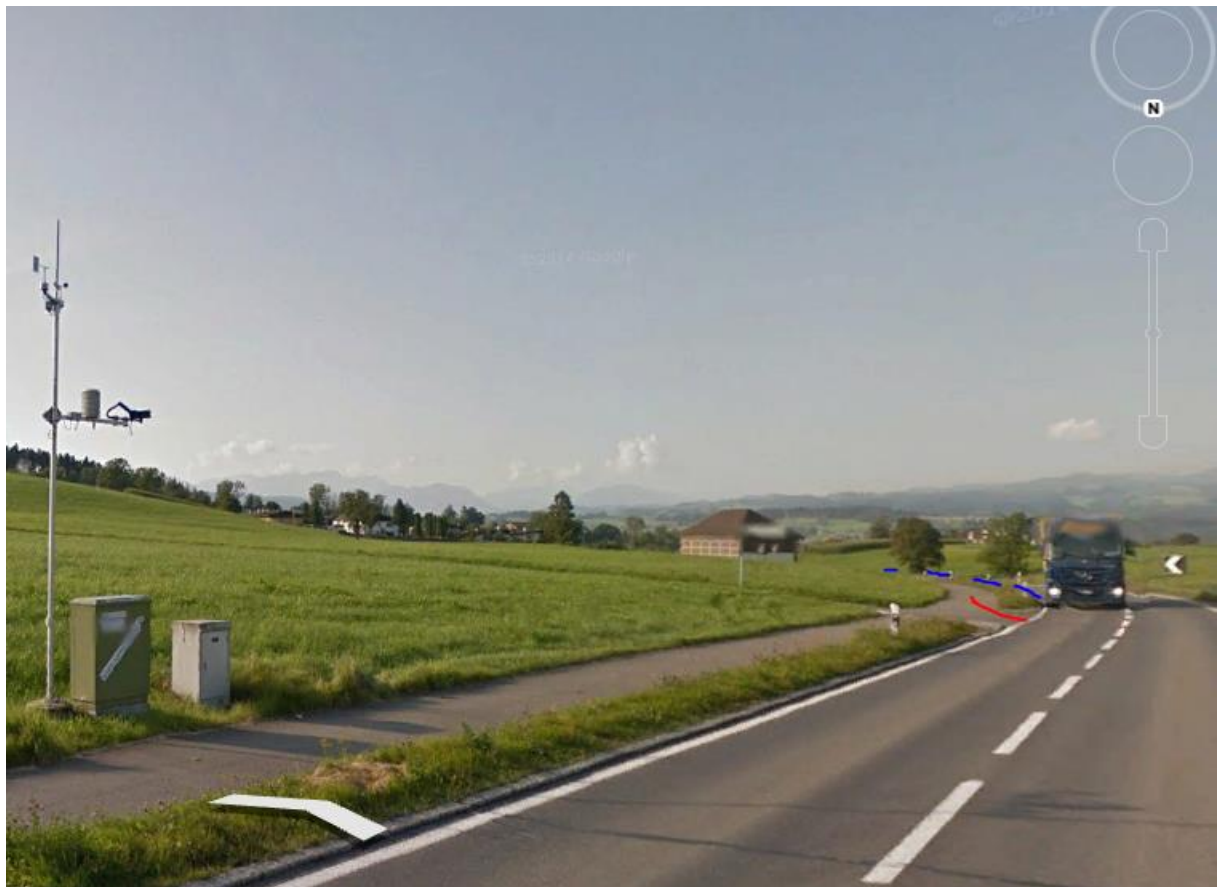
Hat, falls – wie anzunehmen - von Ruswil kommend, die HS-1- Leitung vor Buttisholz gequert. 3000m