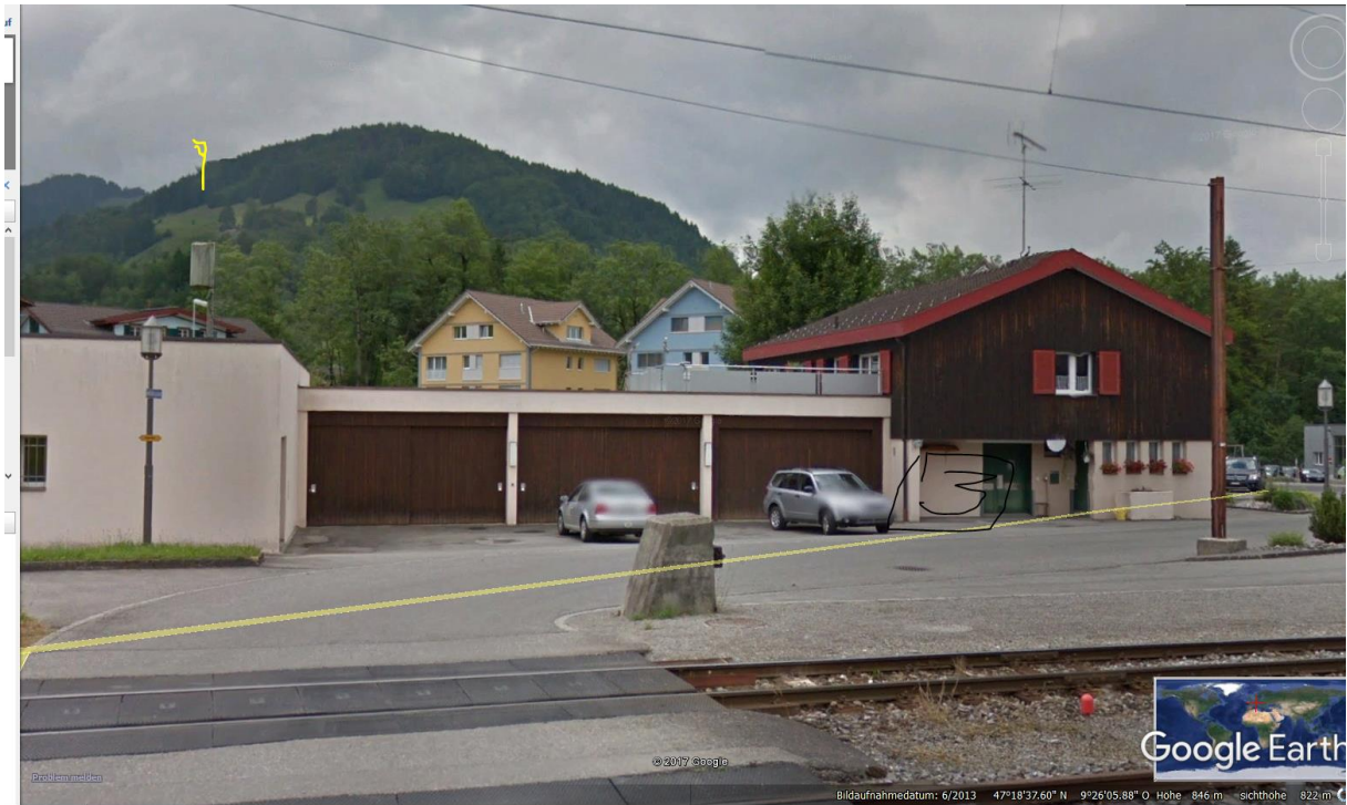
Ein Senderstandort, nicht eingetragen in Bakom-Karte, aber Swisscom-Gebäude. Ev. Polycom