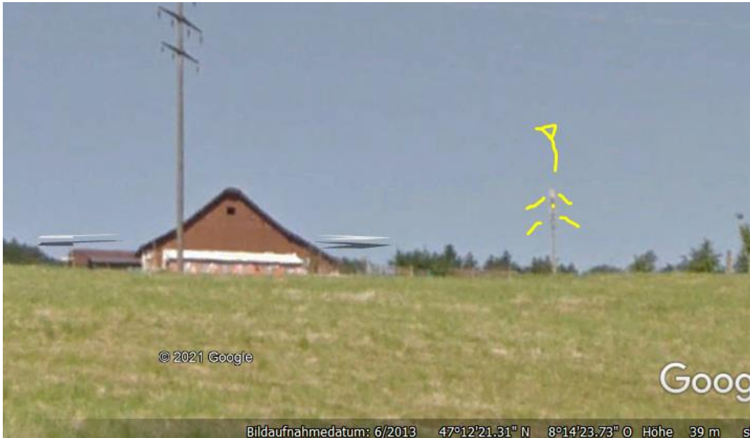
2018 sind aus der Luft im Schattenwurf 3 Senderebenen sichtbar, eine vierter Sender ist vermutlich Polycom, da hier keine Richtstrahlverbindung.