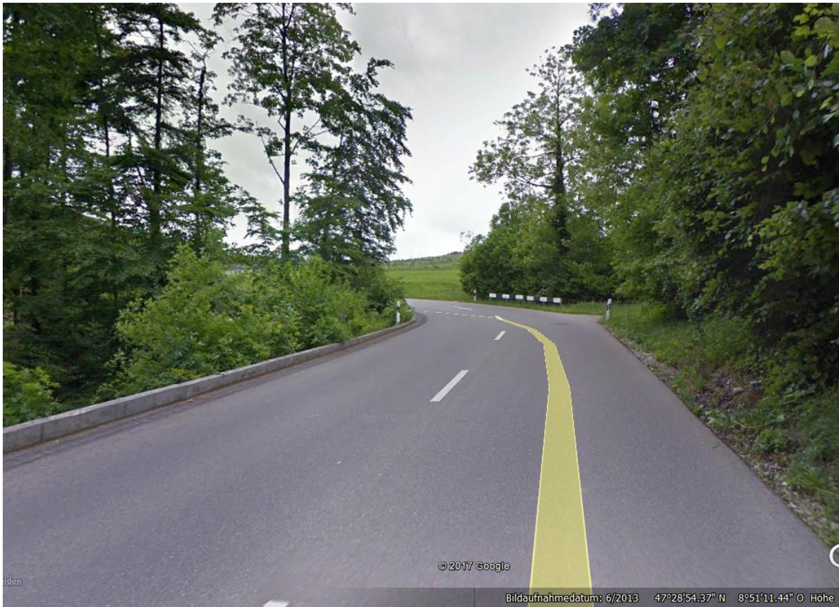
Kurvenfolge mit mehreren ähnlich ausgebauten Kurven, letzte / Unfallstelle ist deutlich enger.