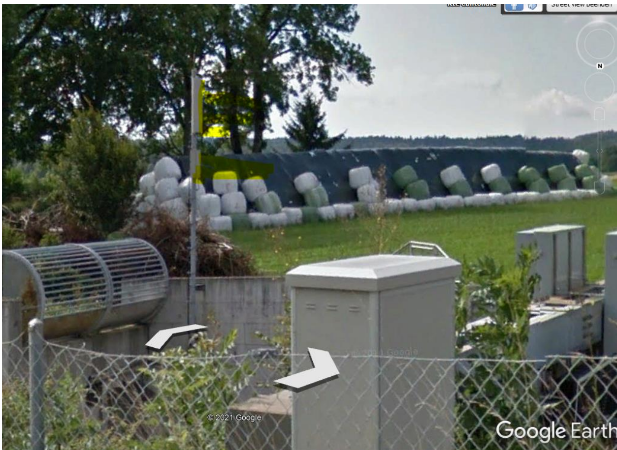
HS-Querung vor längerer Strecke: