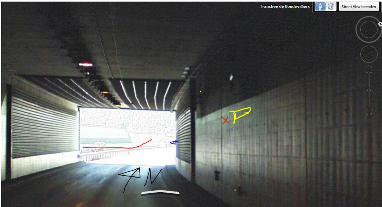
Die Sender innerhalb des Tunnels strahlen gegen innen. Der Sender klein und mittel an der Oberfläche strahlen nach NO