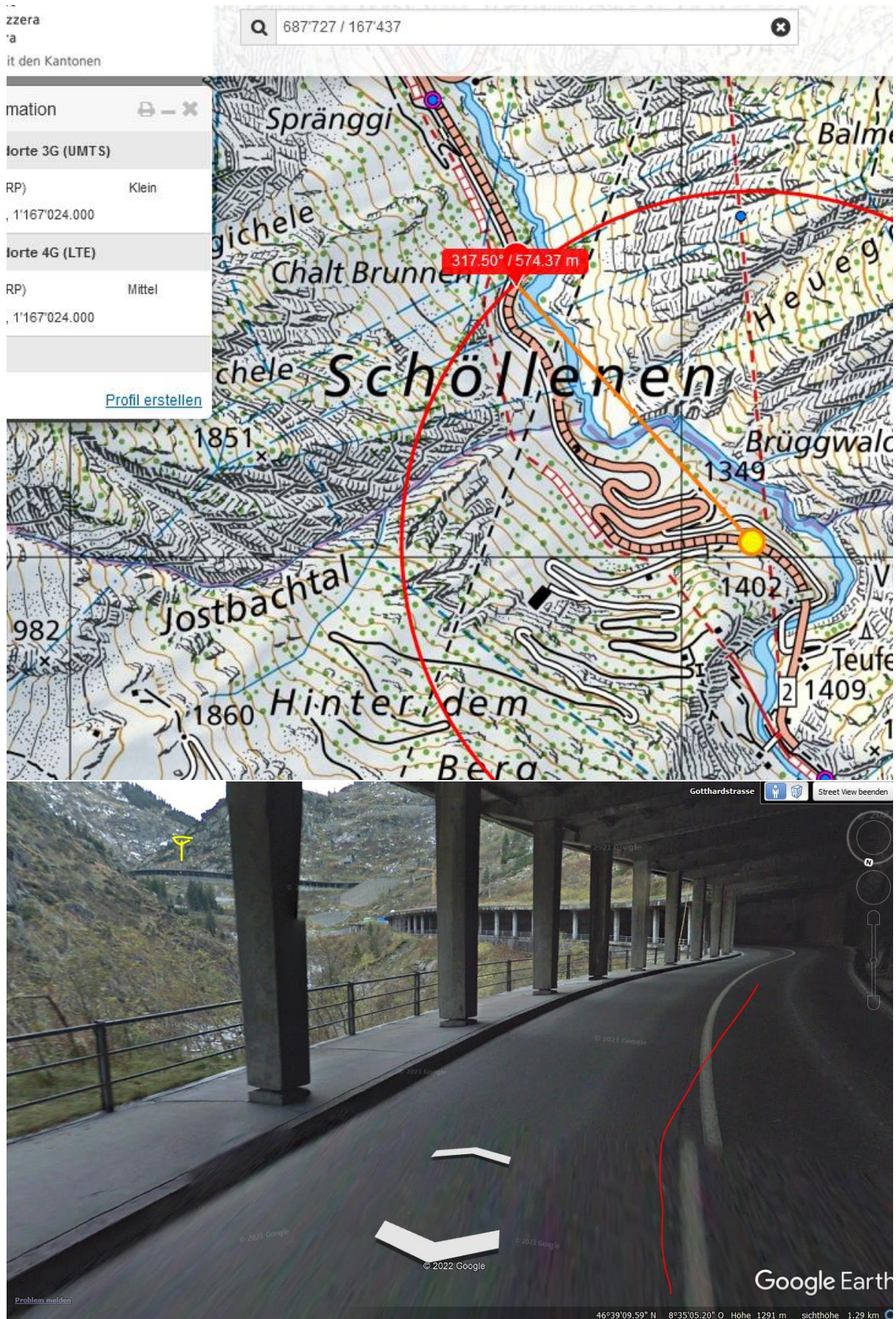
100 m vorher wäre dieser Sender noch durch die Stützen abgeschirmt gewesen