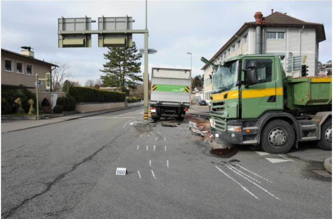
Meilen ZH - Verletzter bei Kollision zwischen zwei Lastwagen – Zeugenaufruf