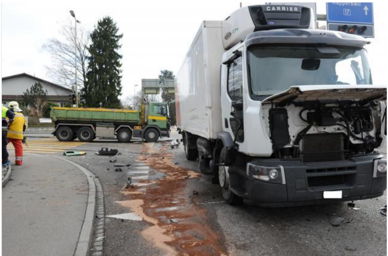
Meilen ZH - Verletzter bei Kollision zwischen zwei Lastwagen - Zeugenaufruf

Personen, welche Angaben zum Unfallhergang machen können, werden gebeten, sich mit der Kantonspolizei Zürich, Verkehrspolizeilicher Einsatzdienst, Telefon 044 247 22 11, in Verbindung zu setzen.