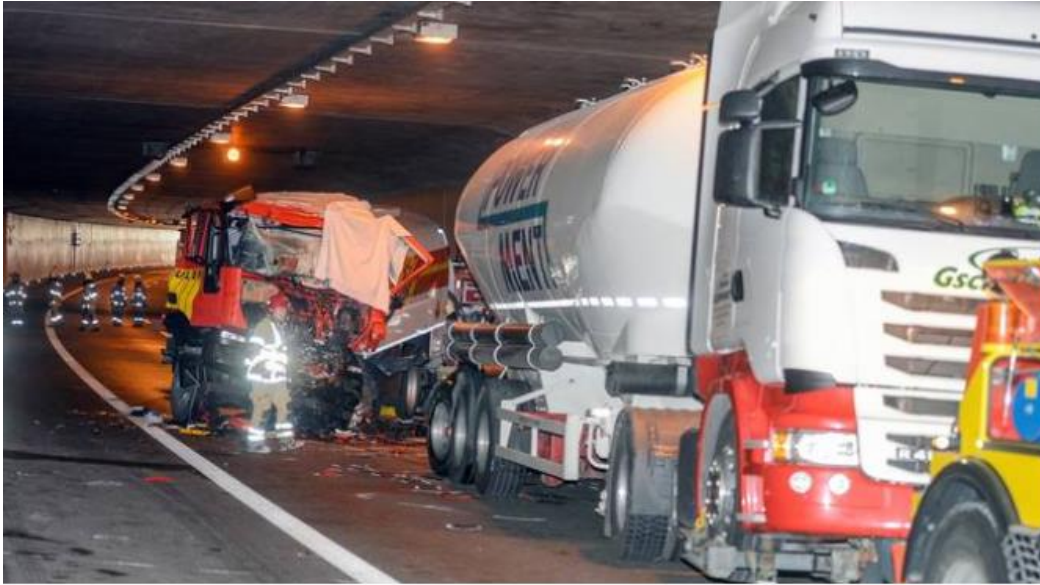
Mit seinem Tanklastwagen prallte ein 36-jähriger Fahrer im Februar 2015 auf einen Sattelzug und wurde getötet. An der Decke sichtbar 2 Signalkästen mit Kreuzen