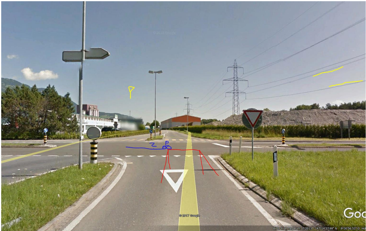
Simon Frick-Strasse 9466 Sennwald