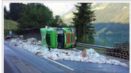
Lungern OW - Umgekippter Sattelschlepper auf der Brünigstrasse

Die genaue Unfallursache wird durch die Kantonspolizei Obwalden abgeklärt.