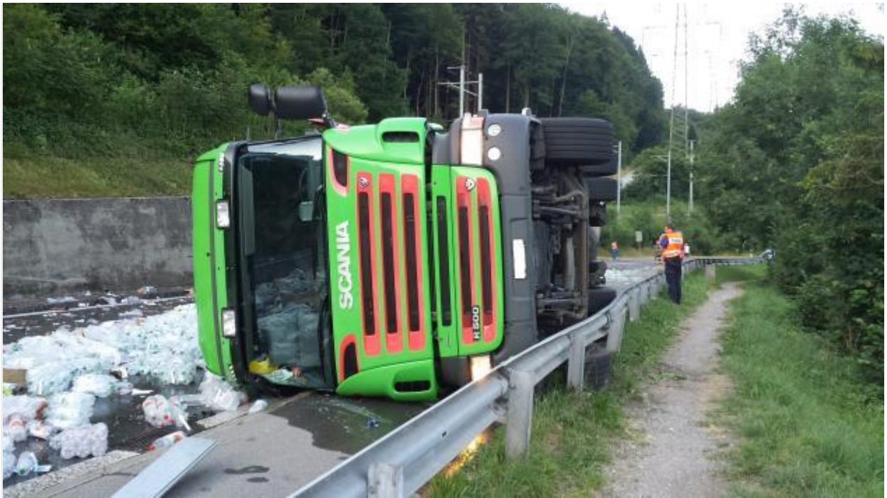
Lungern OW - Umgekippter Sattelschlepper auf der Brünigstrasse Zug Kaiserstuhl OW