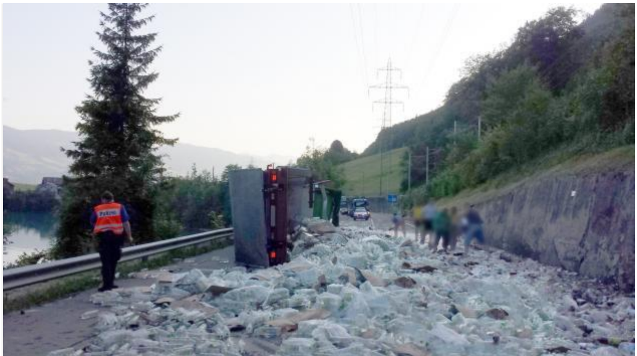
Lungern OW - Umgekippter Sattelschlepper auf der Brünigstrasse