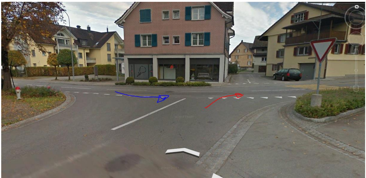
Die Fällung des Baums in diesem alten Bild von 2013 hat die Sicht freigemacht