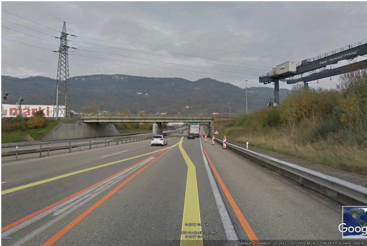
Querung von Ebene 3 vor 700m