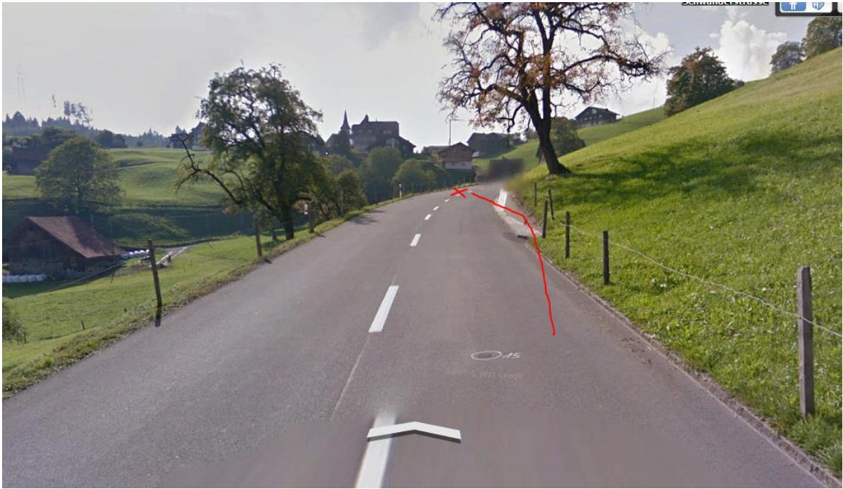
Auf dem unteren Bild: Wald in der Senderichtung, 2013 noch tiefer...