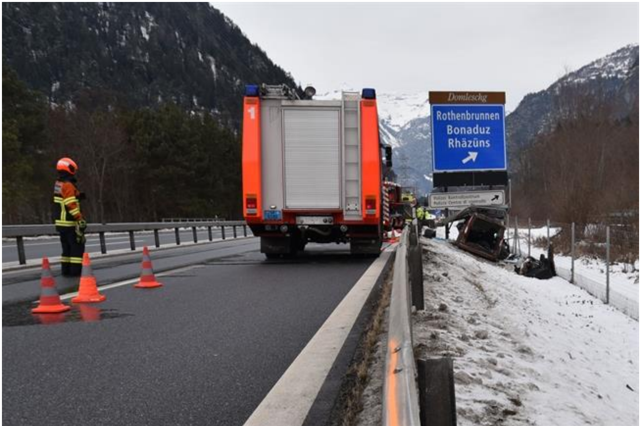
Keine lange Spur an Böschung, quasi über Planke gehüpft.