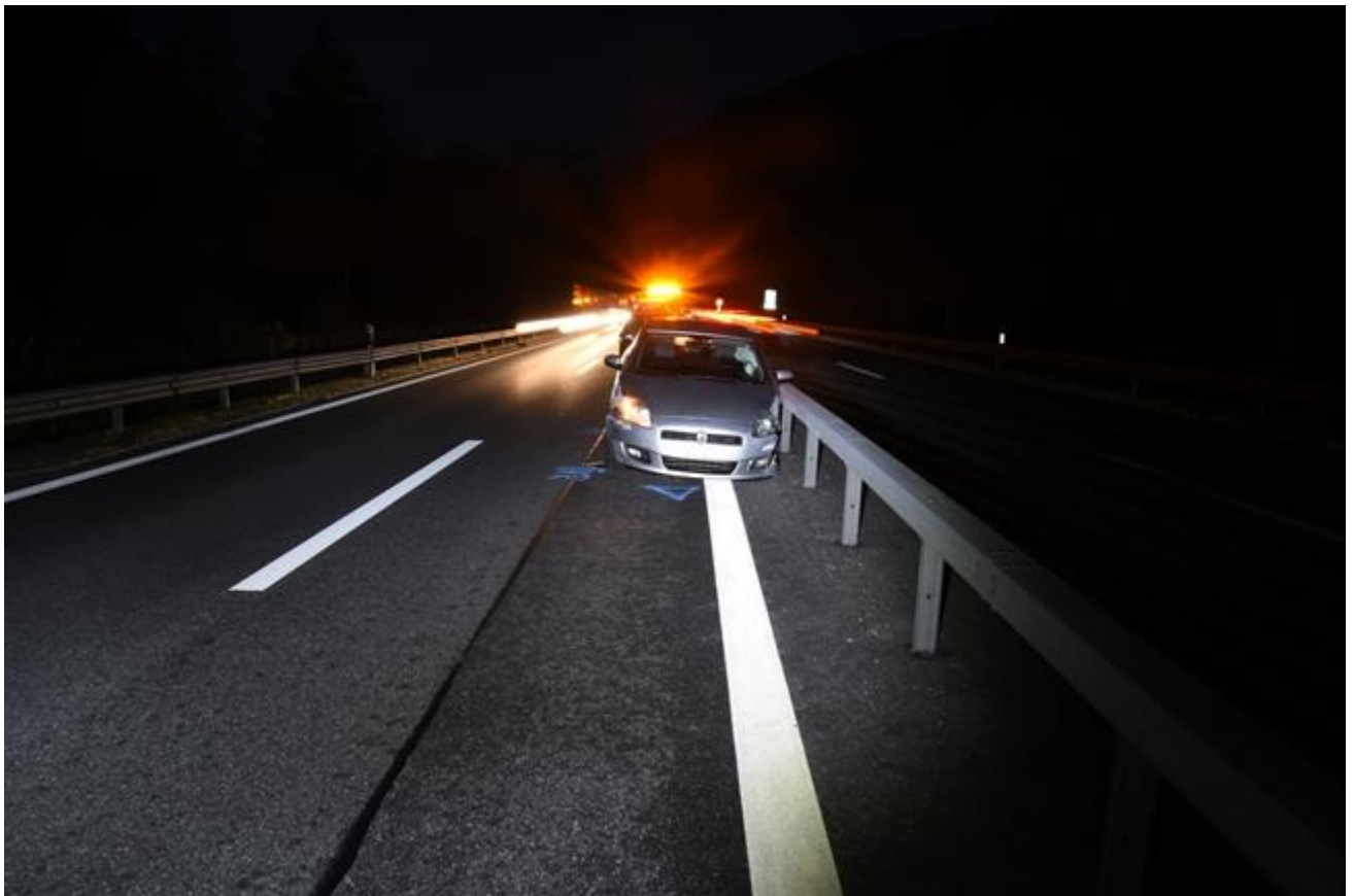
Endlage des Personenwagens an der Mittelleitplanke Grosser Sachschaden am Fahrzeug

Eine 25-jährige Personenwagenlenkerin fuhr um 06:00 Uhr auf der Autostrasse A13 von Reichenau in Richtung Thusis. Nach dem Isla Bella Tunnel überholte sie einen Sattelschlepper , welcher während des Überholmanövers gegen links ausscherte. Um eine Kollision zu vermeiden, steuerte sie ihren Wagen gegen links. Dadurch kollidierte sie mit der Mittelleitplanke. Beim Aufprall wurde das linke Vorderrad des Wagens abgerissen. Das Fahrzeug überquerte in der Folge die Fahrbahn gegen rechts, kollidierte mit der rechtsseitigen Leitplanke und wurde erneut gegen links geschleudert. Schliesslich kam das Auto nach zirka 200 Meter an der Mittelleitplanke zum Stillstand. Die leicht verletzte Lenkerin wurde mit der Ambulanz ins Spital Thusis überführt. Am Personenwagen entstand Totalschaden.