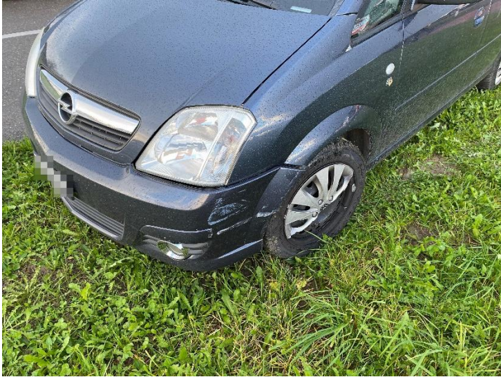
An den Fahrzeugen entstand Sachschaden von mehreren tausend Franken.