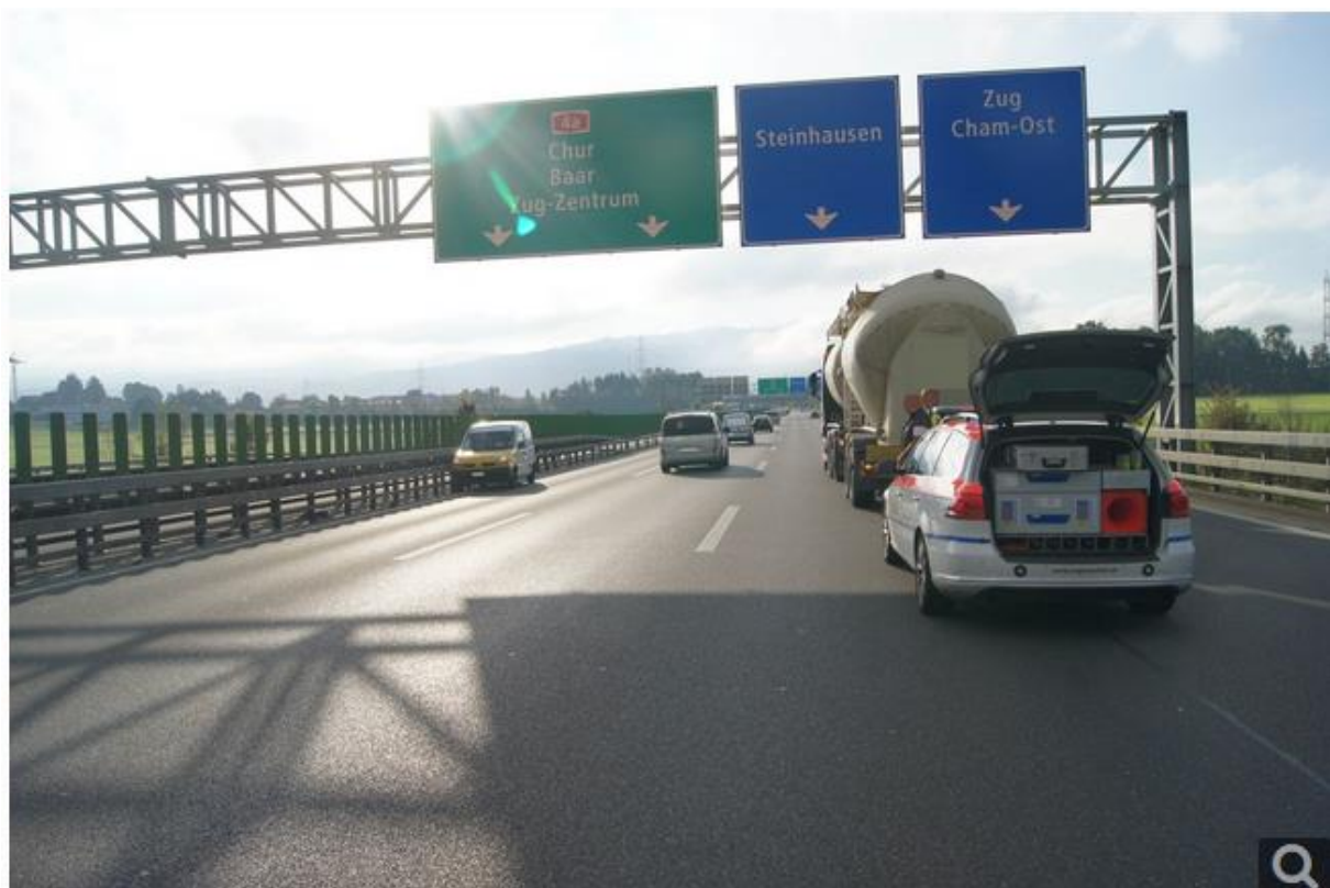
Unfall bei der Ausfahrt Zug

https://www.zg.ch/behoerden/sicherheitsdirektion/zuger-polizei/medienmitteilungen/179-kanton-zug-blechschaden-im-morgenverkehr