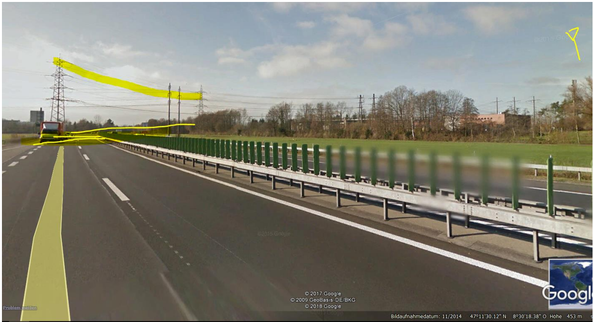
Anfahrstrecke mit Sender links, der in Hauptrichtung A4a weist