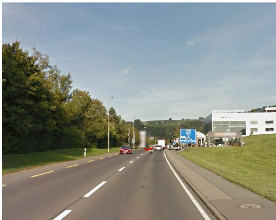
Ortseingangsschild schw. eingekreist