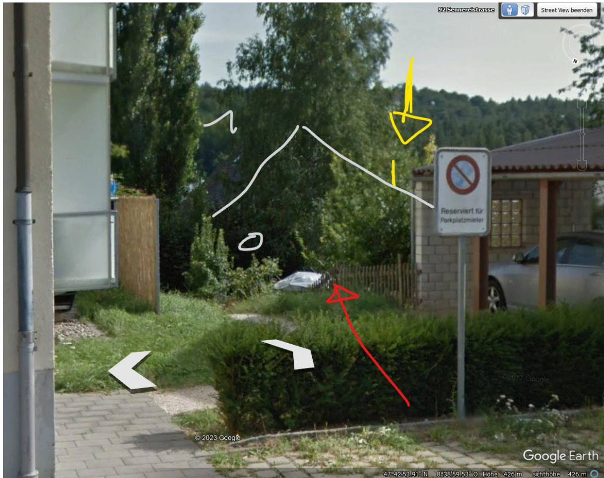
Hellgrau: links Haus 1 mit dem Gartenhaus weiter unten. Der Sender strahlt auf er ansteigenden Sennereihalden sicher ein, auch über den rechts zu sehenden Carport.