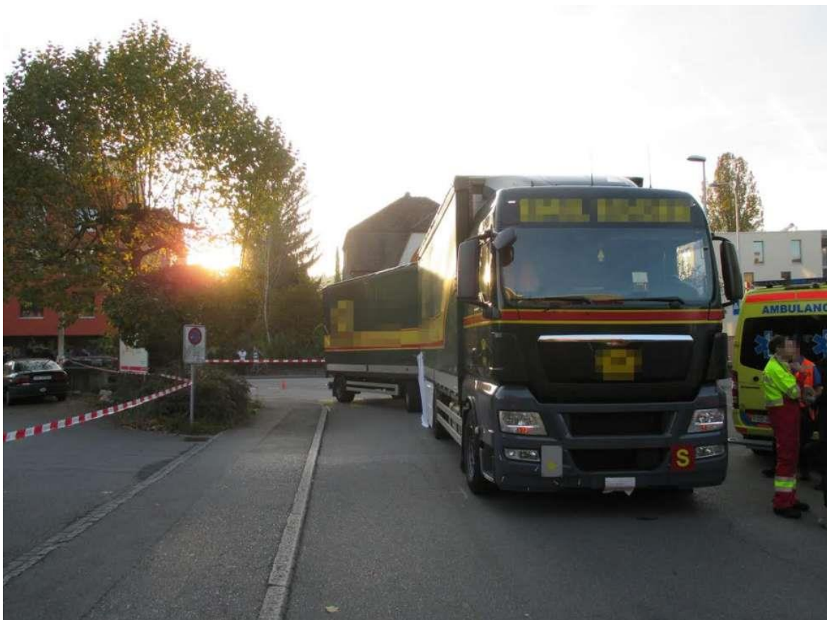
Dieser Lastwagen überfuhr das Kind in Derendingen.

Im Bereich des «Coop» beabsichtigte er in die Steinmattstrasse einzubiegen. Dort erfasste er aus noch ungeklärten Gründen ein Kind, welches mit seinem Fahrrad unterwegs war. Das Kind verstarb noch auf der Unfallstelle. Der Chauffeur, ein 63-jähriger Schweizer, blieb unverletzt. Die Steinmattstrasse blieb aufgrund der Bergungsarbeiten auf dem betroffenen Abschnitt zeitweise gesperrt. Vor Ort war eine Ambulanz im Einsatz.